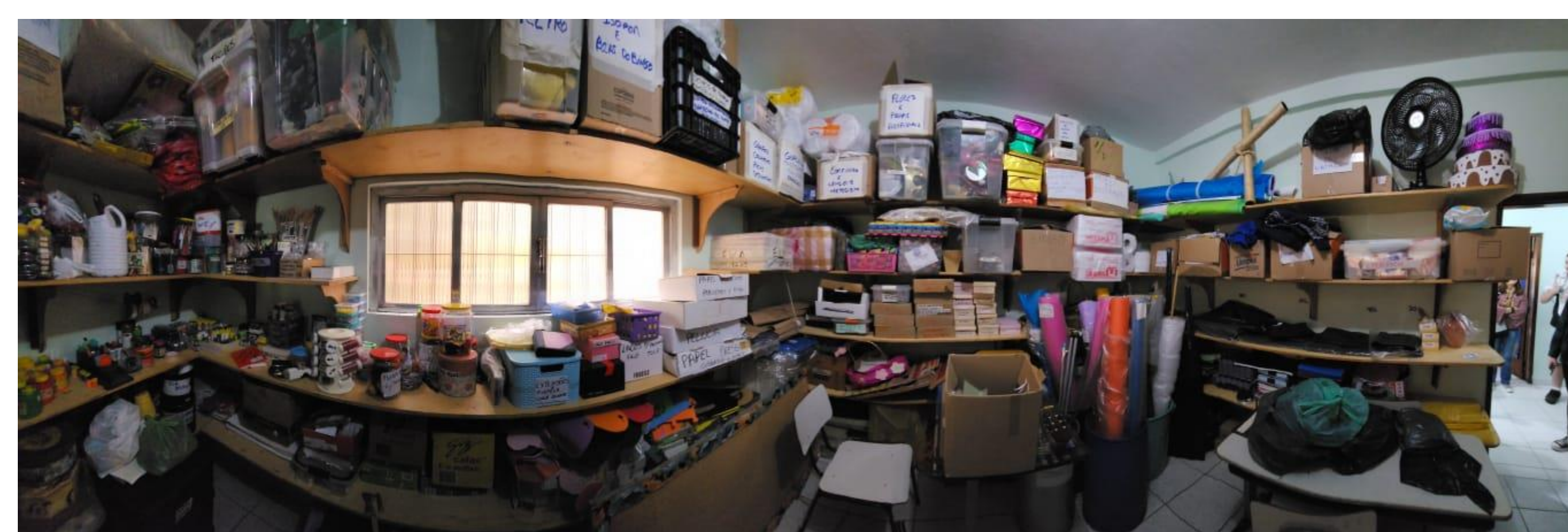
Figura 5 – Depósito do Semeador.