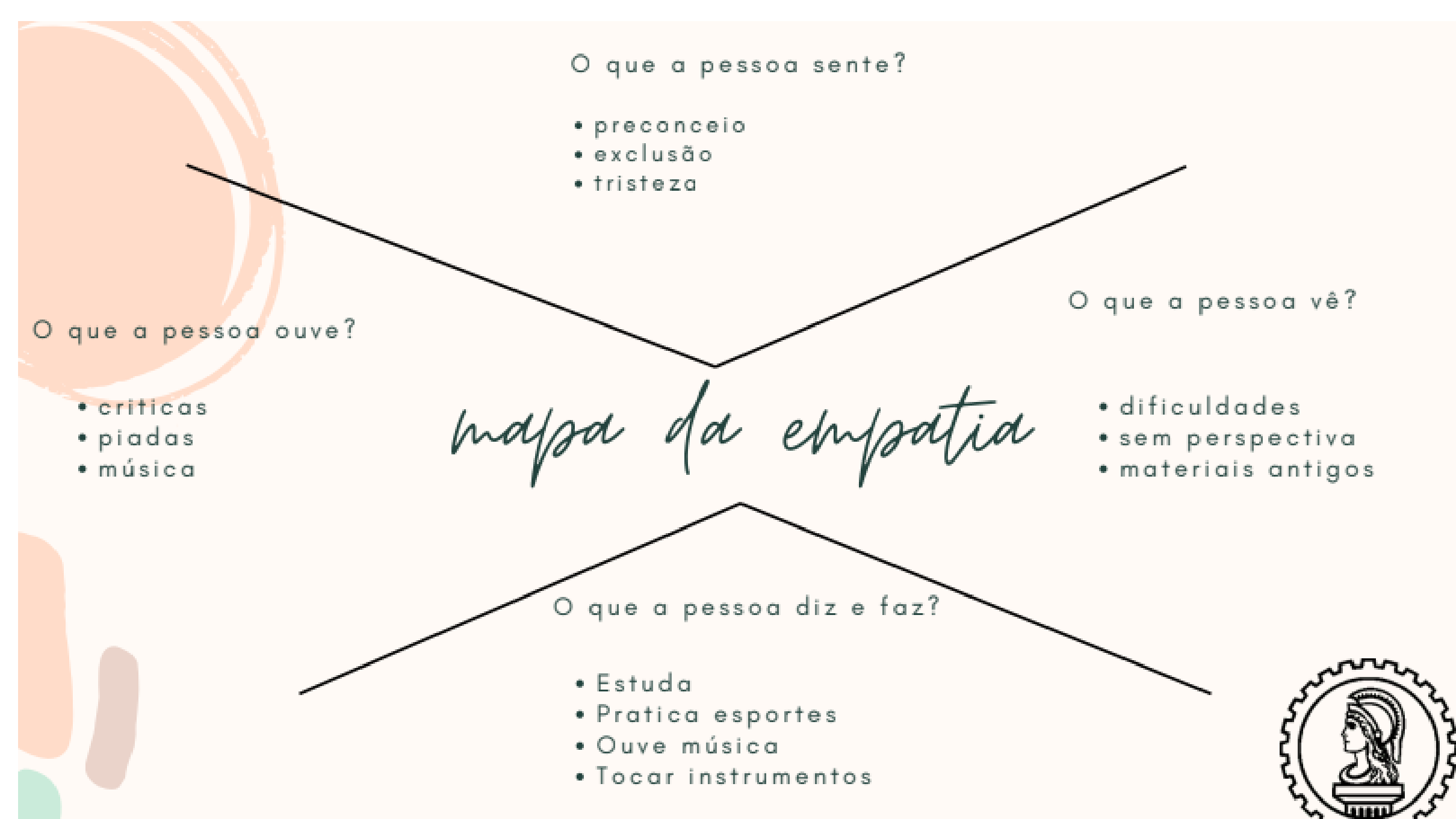
Figura 2 – Mapa de Empatia