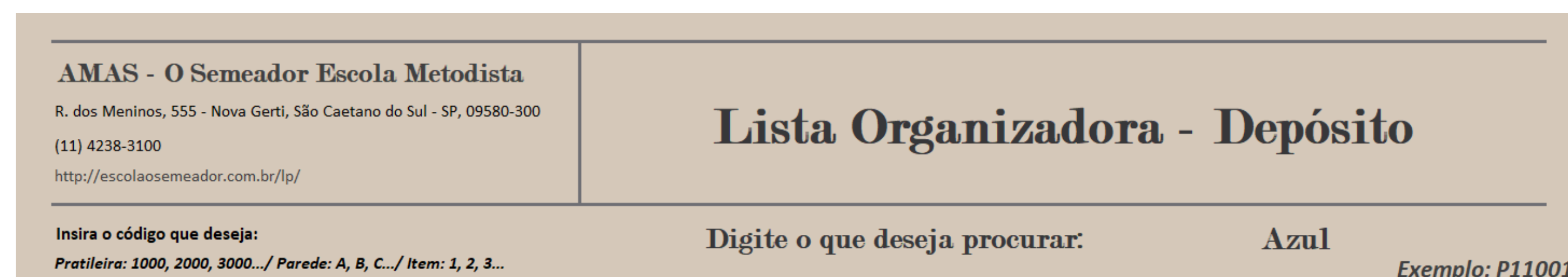
Figura 3 – Barra de pesquisa

A tal proposta apresenta ao AMAS teve como resultado, uma grande otimização para a organização espacial e de tempo no dia a dia da escola. O esqueleto do projeto, pode ser vista nas imagens abaixo.